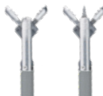
Lepel Ø 1,8 mm, 120 cm lang