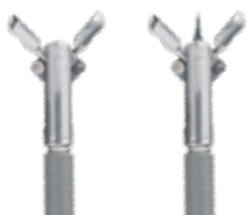
Lepel Ø 1,8 mm, 120 cm lang