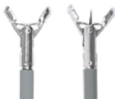
Lepel Ø 1,8 mm, 120 cm lang