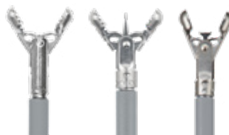
Lepel Ø 2,3 mm, 120 cm lang