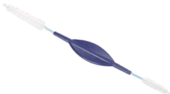
Doppelreinigungsbürste für Luft-/Wasserventile

Die Doppelreinigungsbürste für die Luft- und Wasserventile bietet alles, was eine Bürste für diese Reinigung erfüllen muss. Auf der einen Seite sorgt ein 40 mm langer und 11 mm dicker Bürstenkopf für eine gründliche Reinigung der Ventileinlässe. Auf der anderen Seite können mit der 20 mm langen und 5 mm dicken Bürste sorgfältig die Ventilöffnungen gereinigt werden. Kugelköpfchen an den Enden der beiden Bürsten verhindern, dass die Kanäle des Endoskops beschädigt werden können.