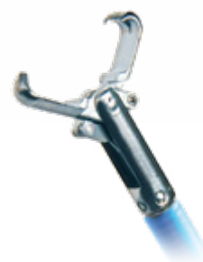
Type 2:1-tanden, glad