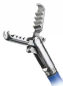
Type Grijp: lange krokodillenbek met 2:1 tanden