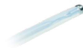
Atraumatische punt ontziet het werkkanaal en het slijmvlies