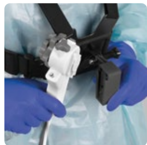
Solide bevestiging van de cholangioscoop aan het harnas.