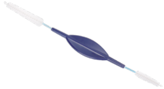
Dubbele reinigingsborstels voor lucht-/waterventielen

De dubbele reinigingsborstel voor de lucht- en waterventielen biedt alles wat een borstel voor deze reiniging dient te hebben. Aan de ene kant zorgt een 40 mm lange en 11 mm dikke borstelkop voor een grondige reiniging van de ventielinlaten. Aan de andere kant kunnen de ventielopeningen met de 20 mm lange en 5 mm dikke borstel zorgvuldig gereinigd worden. Kogelkopjes aan de uiteinden van de twee borstels voorkomen dat de kanalen van de endoscoop worden beschadigd.