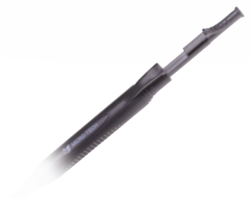
Handliches ergonomisches Design