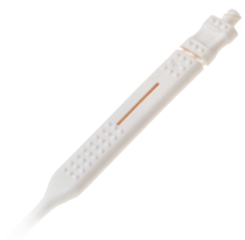
Ergonomischer Handgriff mit definierter Sollbruchstelle