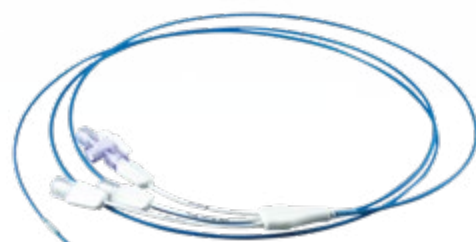
3-lumige steen-extractieballon van MICRO-TECH